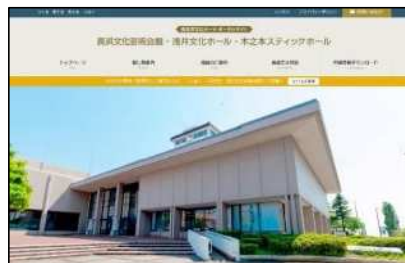
文化ホールホームページ運用状況 (R4. 4. 1~R5. 3. 31)