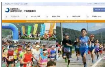
事業団ホームページ運用状況 (R4. 4. 1~R5. 3. 31)

内容：お知らせ、イベント・教室、 施設の案内、施設空き状況、 事業団について(概要・情報公開)