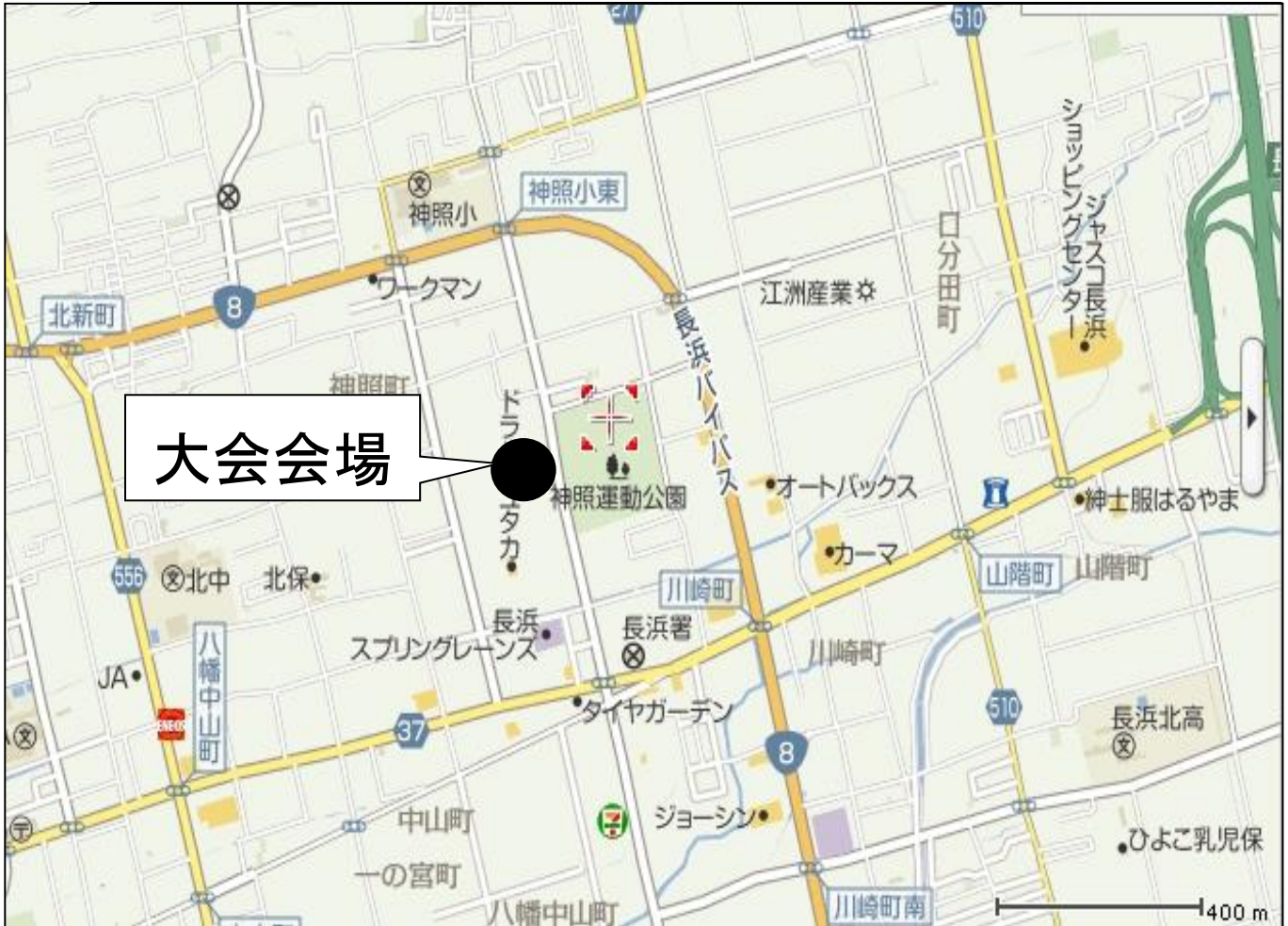
神照運動公園 レクリエーション広場