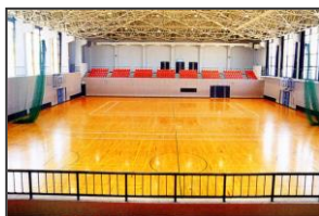
Quadra de esportes