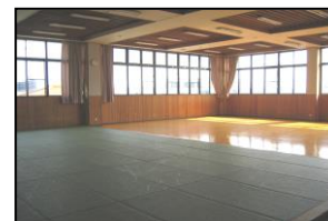
Dojo para judô e kendô

※ meio dojo é tatami uso: judô, kendô, karate e outros