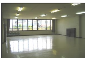
Salão para atividades diversas

※ meio dojo é tatami uso: judô, kendô, karate e outros