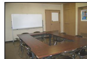
Sala de reuniões

※ máx.20 pessoas Uso: reuniões ref.a esportes