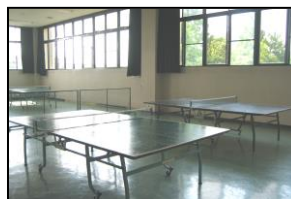
Salão de tênis de mesa